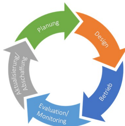
Abbildung 3: Richtlinien-Lebenszyklus COBIT 5

Zur Erstellung, fortlaufenden Überprüfung und bedarfsbezogenen Weiterentwicklung der in diesem Dokument dargelegten Architekturvorgaben wird der im Governance Framework COBIT 5 142 definierte Richtlinien-Lebenszyklus herangezogen. COBIT 5 wird innerhalb des TOGAF Frameworks als Referenzwerk für IT-Governance genutzt, da es einen offenen Standard zur Steuerung der IT darstellt. Der Richtlinien-Lebenszyklus dieser Architekturrichtlinie orientiert sich an den in der folgenden